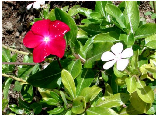
Figure 9. Catharanthus roseus .

de Madagascar, Catharanthus roseus , sous-arbrisseau tropical dont les fleurs peuvent également être blanches, à parties aériennes riches en alcaloïdes utilisés en chimiothérapie anticancéreuse (Figure 9).