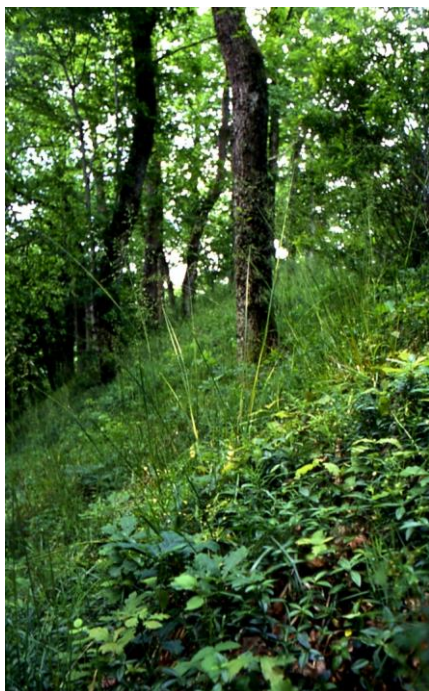
Figure 7. Tapis de Pervenches sur la motte féodale d'Espartignac.

La Pervenche apparaît plus régulière sur les vestiges d'époque médiévale : ainsi en Limousin est-elle observée dans le département de la Corrèze sur l'éperon barré de Puycastel (commune d'Aubazine), la motte féodale d'Espartignac (commune d'Espartignac) (Figure 7), ainsi que dans les ruines du château de Ventadour (commune de Moustier-Ventadour) (Ghestem et al. , 1993). On retrouve la Pervenche dans les mêmes situations, par exemple dans le Cantal dans les ruines du château de Courdes, commune de Méallet (Crozat, 1999).