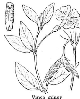
Figure 4. Représentation d'après Coste, 1903.

Les 5 sépales sont courts ; les 5 pétales, tronqués au sommet, sont soudés à leur base en un tube dépassant nettement le calice ; chacune des 5 étamines est soudée au tube de la corolle ; enfin il y a 2 carpelles antéro-postérieurs. Le fruit est formé théoriquement de 2 courts follicules divergents (Figure 4) pauciséminés, mais généralement l'un ou même les deux avortent.