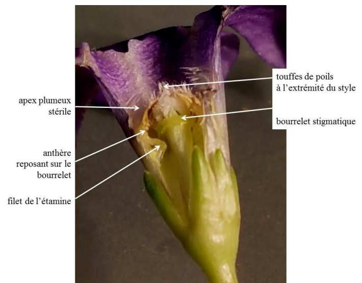
Figure 5. Coupe longitudinale d'une fleur

La fleur présente une particularité structurale : les 2 stigmates se soudent en un bourrelet circulaire et surmonté par une excroissance du style pourvue de faisceaux de poils ; les anthères, pourvues d'un apex plumeux, se posent sur ce bourrelet, mais le pollen ne peut atteindre la partie réceptive des stigmates située sous le bourrelet : la pollinisation directe n'est donc pas possible, et peu d'insectes peuvent pénétrer cette corolle à ouverture étroite et obstruée par les poils du style. (Figure 5)