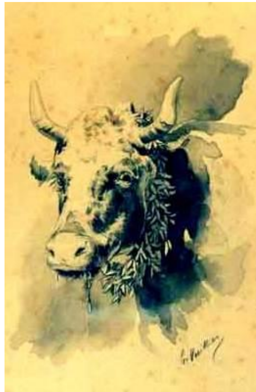
Figure 6. Vache au collier de pervenches. Dessin aquarellé de Gaston Vuillier, vers 1899 Musée de Tulle

Au XIX e siècle, en Corrèze, on fait porter autour du cou des vaches un collier de pervenches sensées soulager leurs maux d'yeux (Figure 6).