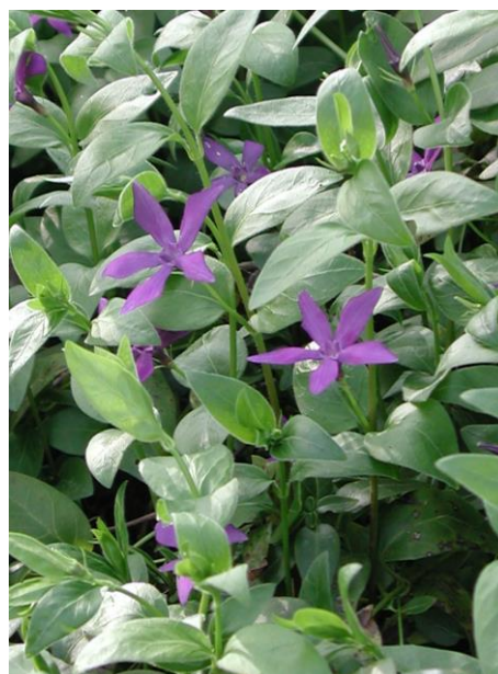
Figure 8. Veronica difformis .

- Vinca major , plus robuste, à feuilles ciliées et sépales également ciliés ; très fréquemment introduite dans les jardins, à feuilles vertes ou panachées.