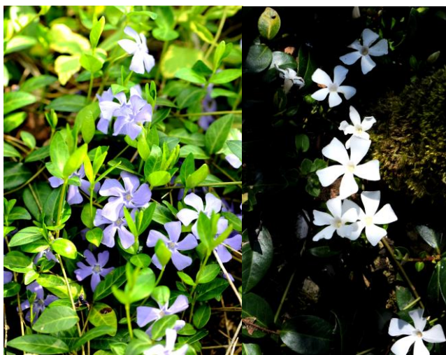
Figure 3. a) forme type ; b) forme blanche.

Les courtes tiges florifères dressées, peu feuillées, portent des fleurs solitaires bleues ou violacées, plus rarement blanches, s'épanouissant de février à juin et à nouveau à l'automne (Figures 3a et b).