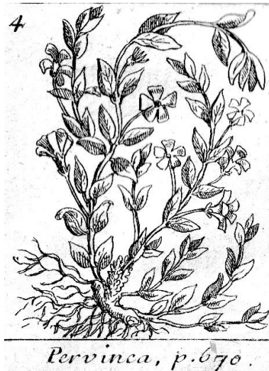
Figure 2. Illustration Lémery, 1759.

Elle recevra de nombreux surnoms traduisant son caractère magique : violette des sorcières , violette des morts , bergère , buis bâtard , ainsi que violette des serpents , car elle était aussi sensée soulager les morsures de serpent en étant appliquée.